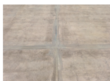
Rechte zaagsneden in de breedte- en lengterichting van de hal