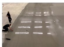
Egaliseren voor een vlakke ondervloer