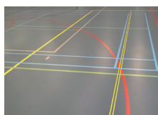
Oude Pulastic sportvloer

Hoofdaannemer: Sika Nederland B.V. locatie Deventer – Pulastic sportvloeren Gem. Enschede – BMO – afdeling sportaccommodaties Gem. Enschede – BMO – VBE – afdeling vastgoedbeheer en tech. projecten Sika Nederland B.V. locatie Utrecht Conflexx Vaessen Vloersterk Heerenveen Nijha BV UTS Grijsma Enschede B.V. Structon Worksphere B.V.