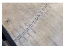
Overige scheuren behandeld met lamellen