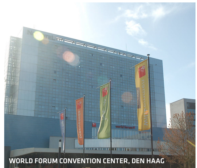
WORLD FORUM CONVENTION CENTER, DEN HAAG