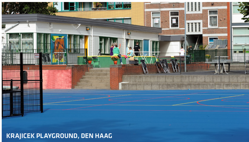
KRAJICEK PLAYGROUND, DEN HAAG