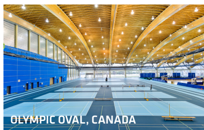
OLYMPIC OVAL, CANADA