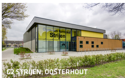
G2 STRIJEN, OOSTERHOUT