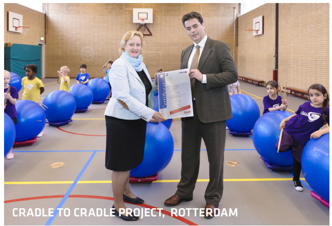
CRADLE TO CRADLE PROJECT, ROTTERDAM