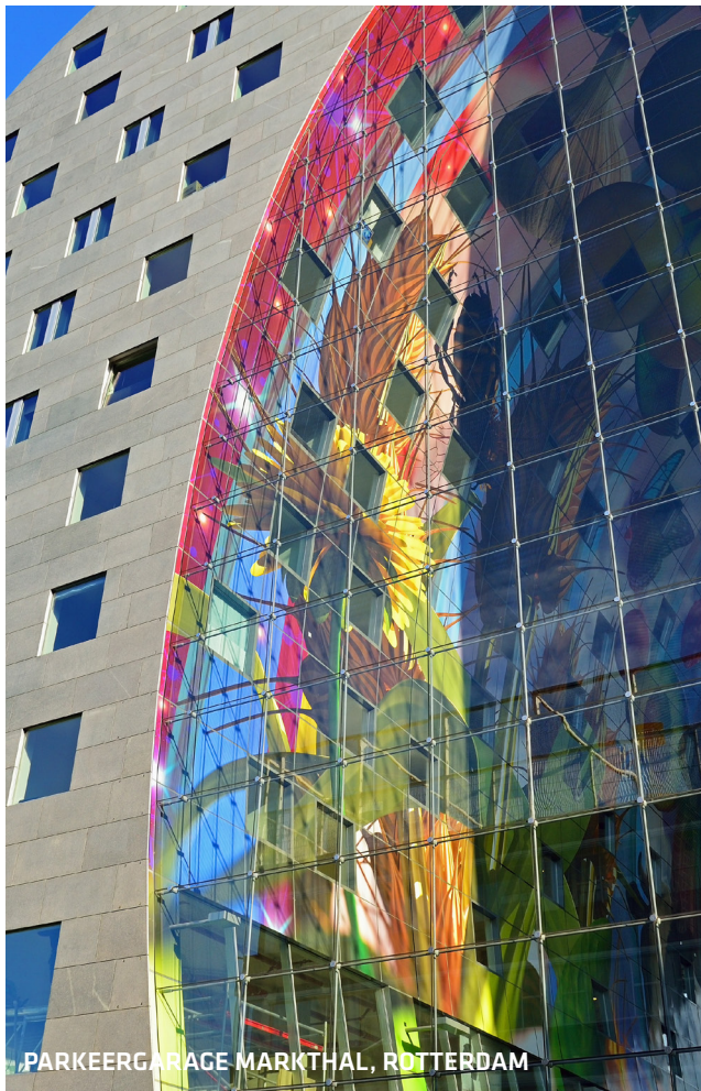
PARKEERGARAGE MARKTHAL, ROTTERDAM