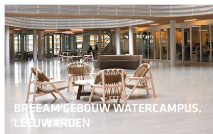
BREEAM GEBOUW WATERCAMPUS, LEEUWARDEN

VOOR MEER INFORMATIE, ZIE WWW.SIKA.NL WWW.PULASTIC.COM WWW.SIKA.COM/SUSTAINABILITY