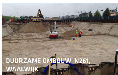
DUURZAME OMBOUW N261, WAALWIJK