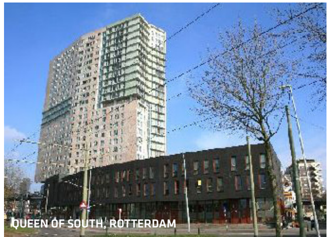
QUEEN OF SOUTH, ROTTERDAM